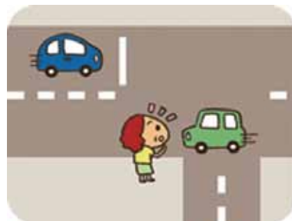
②路地(右)から来た別の車にびっくりする。