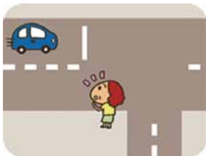
①左から来る車に気づいて1度立ち止まる。