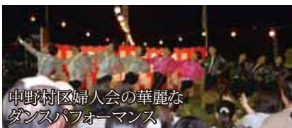
中野村区婦人会の華麗なダンスパフォーマンス

8月4日の「橋の日」、谷瀬の吊り橋と上野地河川広場で、つり橋まつり「揺れ太鼓」が行われました。