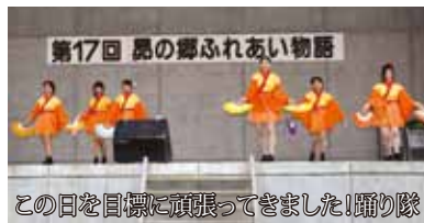
この日を目指して頑張ってきました！踊り隊