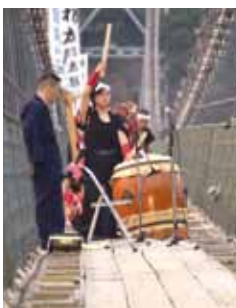
迫力のある演奏 (谷瀬の吊り橋上)