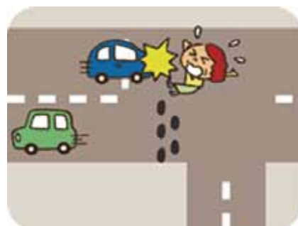
④道路を渡ってしまい、青い車にひかれる。