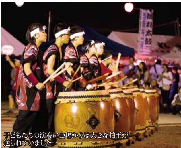
子どもたちの演奏に会場からは大きな拍手が送られていました